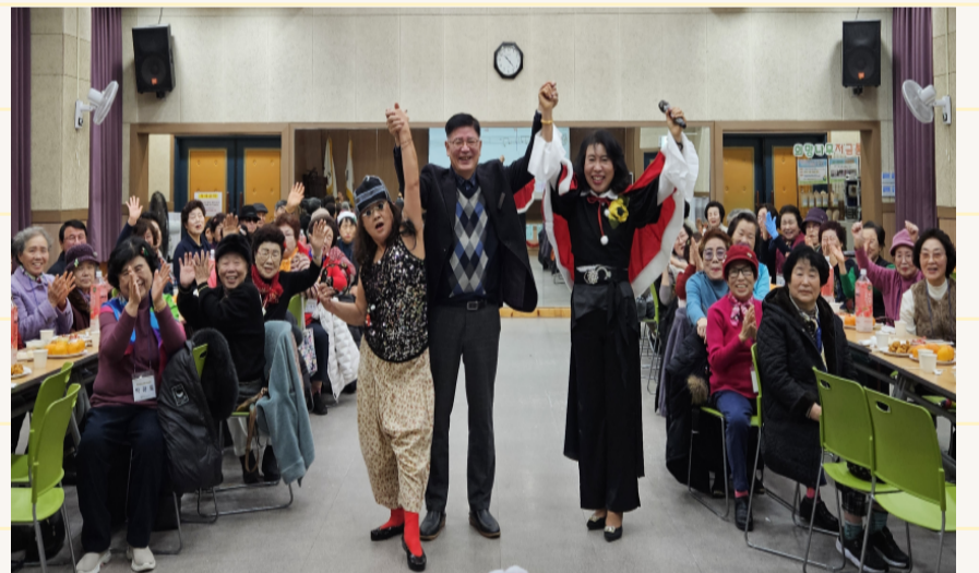
12.16. 평생교육지원사업 화요노래반 송년회