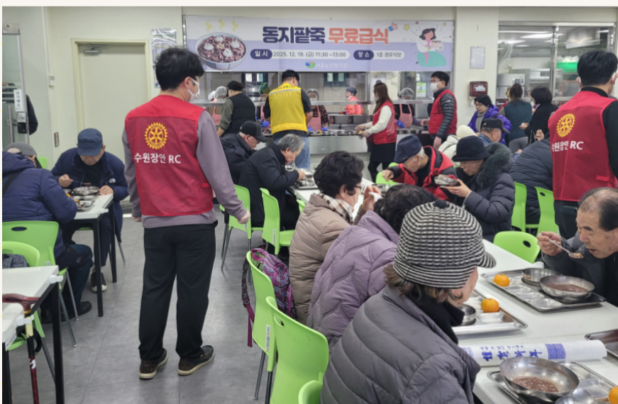
12.19. 동지팔죽 무료급식