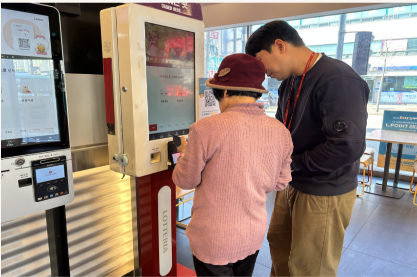
12.12. 롯데리아 키오스크 활용체험