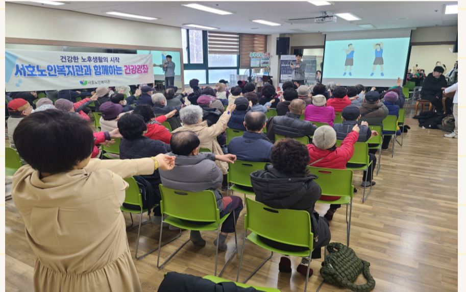
12.10. 수원역정형외과 연계 건강강좌