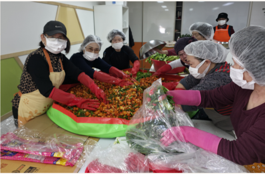
12.2. 서호노인참여나눔터 나눔활동