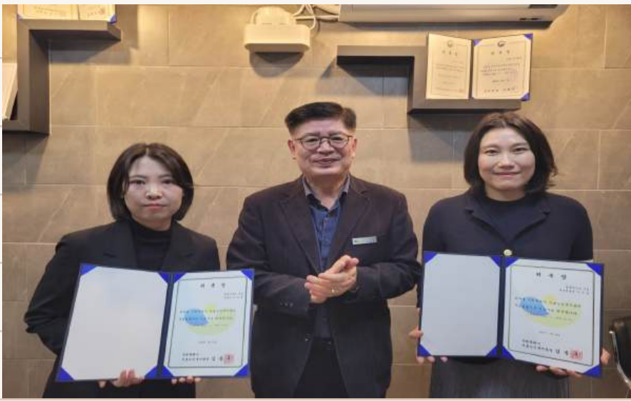
2.20. 이수임법률사무소 협약식