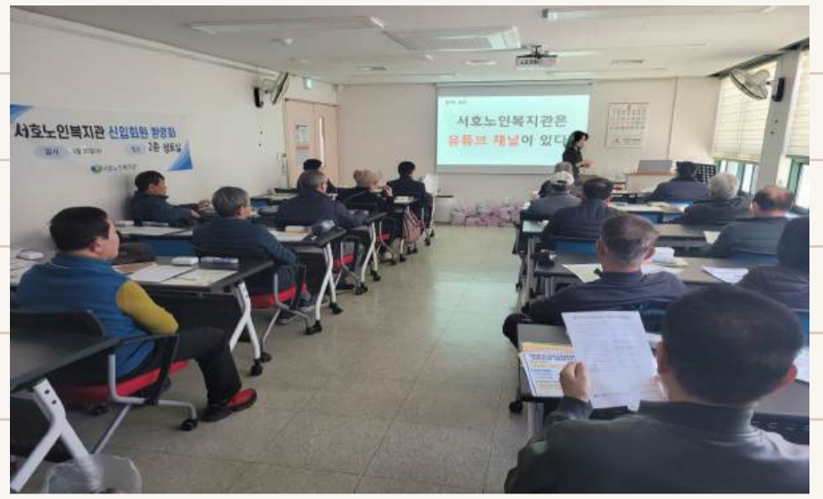
2.25. 2월 신입회원 환영회