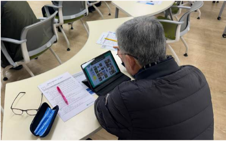
2.26. 생명숲100세힐링센터 오리엔테이션